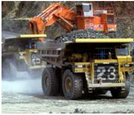
Uranabbau in Australien